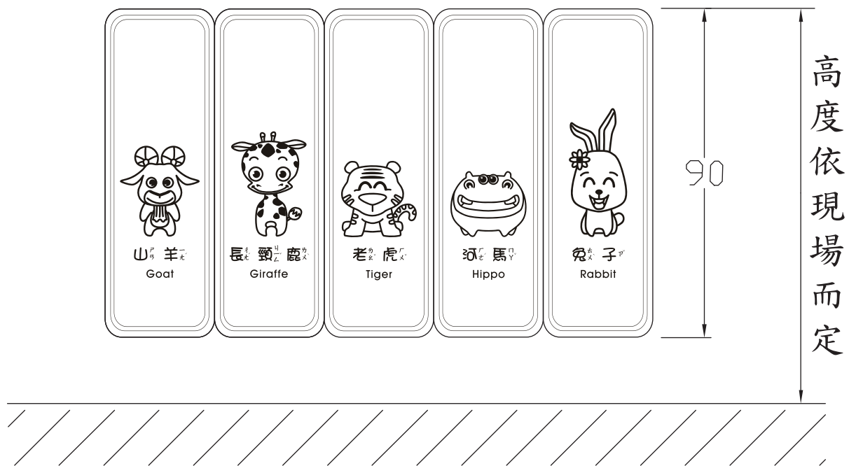
柱角防撞條施工位置圖